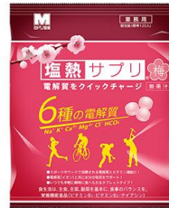
塩熱サプリ® (レモン風味)